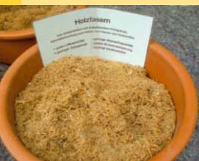
Pflanzenfasern sind eine gute Alternative zu Torf

Viele Hobbygärtner bringen jedes Jahr große Mengen Torf in ihrem Garten aus - im falschen Glauben, es handle sich dabei um einen Bodenverbesserer. Dabei kann der extrem nährstoffarme Hochmoortorf die Bodenqualität verschlechtern und zu einer Versauerung des Bodens beitragen. Zumeist ist daher die Verwendung von gut verrottetem Gartenkompost, Rindenumus oder anderen vorkompostierten Zuschlagstoffen aus Stroh, Chinaschilf, Mais oder Sonnenblumen die bessere Wahl. Als Weißtorfersatzstoff bringen Holzfasern als Zuschlagstoff gute Ergebnisse (gute Durchlüftung, gute Strukturstabilität). Insgesamt stellen somit, insbesondere im Privatgartenbereich, verschiedene nachwachsende Rohstoffe qualitativ und quantitativ eine gute Alternative zu Torf dar.