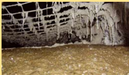
Abbildung 1: Innenansicht Fermenter

In der Praxis wird unterschieden zwischen sogenannten NawaRo-Anlagen, die als Einsatzsubstrate die Exkremente von landwirtschaftlichen Nutztieren sowie speziell für die Biogasanlage angebaute nachwachsende Rohstoffe einsetzen, und Bioabfallanlagen, die Speisereste, abgelaufene Lebensmittel, Schlachtabfälle, Grünschnitte usw. vergären. Die NawaRo-Anlagen haben in Hessen mittlerweile einen Anteil von über 90% erlangt, denn sie erhalten bei der Stromvergütung den sogenannten NawaRo-Bonus, um die zusätzlichen Kosten des Energiepflanzenanbaus zu würdigen.