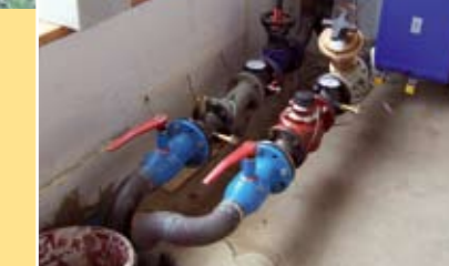
Abbildung 3: Anschluss einer Fernwärmeleitung von einer Biogasanlage im Blumengroßhandel